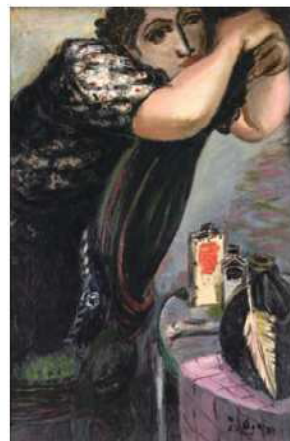
荻太郎《椅子による女》

本展では、当館収蔵の初期から晩年にかけての作品と関連資料を併せて展示し、生涯人間をテーマに制作し続けた画家のまなざしを展観します。