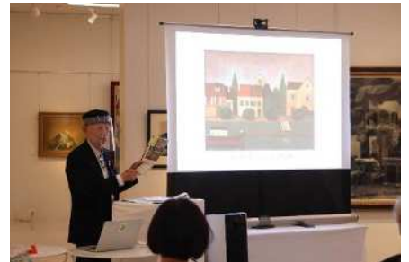
鈴木信太郎展トークショーの様子(R3.10月)