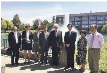
姉妹都市友好の橋の命名式 Fairfield-Nirasaki Sister City Friendship Bridge dedication ceremony

Delegation sent for 45th anniversary commemoration.