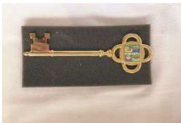
友好の鍵 Friendship Key