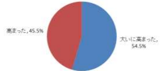
1 中高生懇話会の手法について(複数選択可)