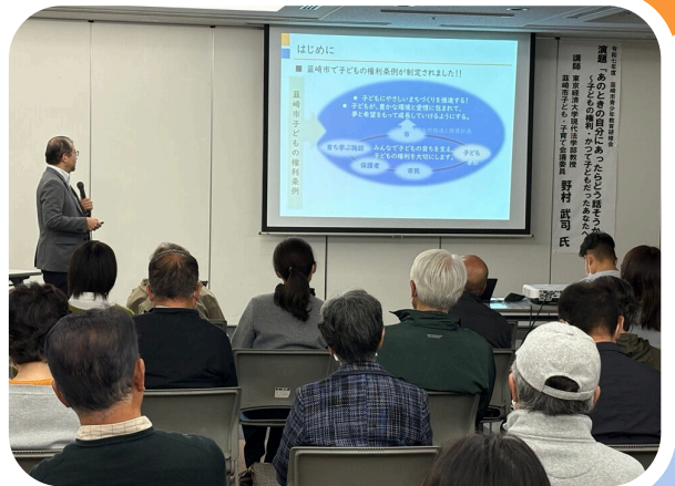
がくしゅうかい おとなのみなさんの学習会