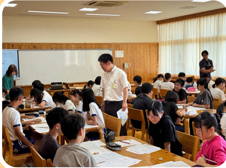
にらさきしょうがっこう ねんせい じゅぎょう 韮崎小学校6年生の授業