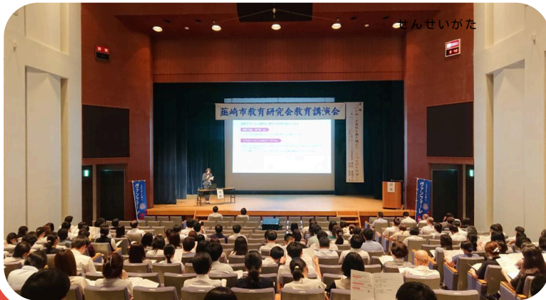
しょうちゅうがっこう せんせいがた がくしゅうかい 小中学校の先生方の学習会