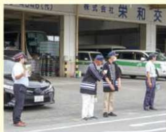
踏切手前の市道でJR職員も参加して 踏切事故防止を呼びかけ