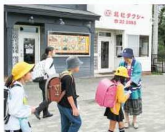
JR駅前広場で 通学児童に交通安全を呼びかけ