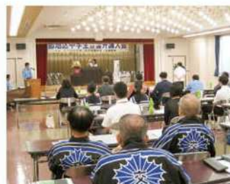
中学生による 交通安全弁論大会を開催