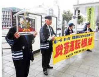
JR駅において通勤・通学者等に 飲酒運転根絶を呼び掛け