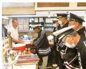
管内の飲食店に 飲酒運転の根絶を呼び掛け