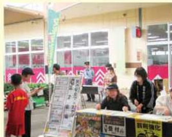
大型商業施設の交通安全 フェスティバル会場での広報啓発活動