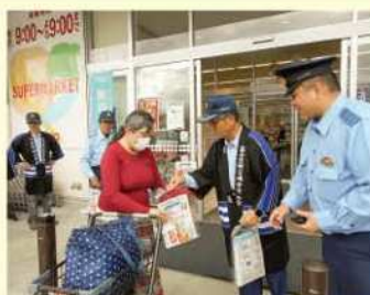
大型ショッピングセンター前での 広報啓発活動