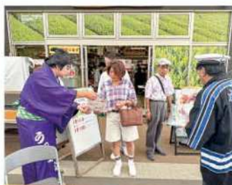
地元の歌舞伎役者が 秋の全国交通安全活動を応援