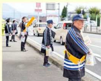
国道を通行する車両に 交通安全を呼びかけ