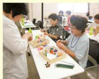
婦人部が 交通安全啓発グッズを制作