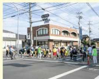
児童の安全安心な 通学を守る活動