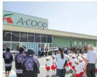
秋の全国交通安全運動に 地元の幼稚園児がマーチングを披露