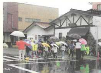
児童の見守り活動