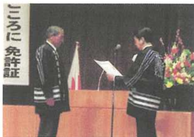
功勞団体に対する会長表彰