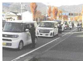
飲酒運転防止啓発活動