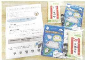
飲酒運転防止広報活動