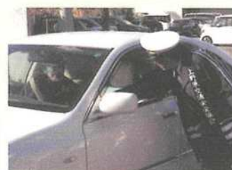
年末の交通事故防止県民運動