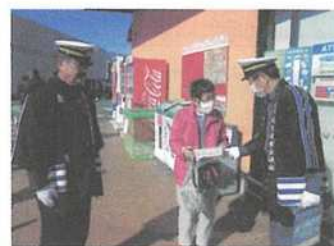
年末の交通事故防止県民運動