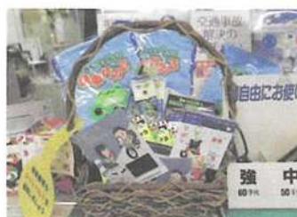
交通安全グッズコーナーの設置