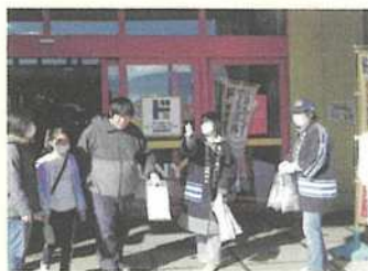
年末の交通事故防止県民運動