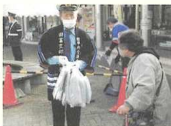
年末の交通事故防止県民運動