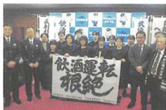
高校書道部と民間企業との連携による 飲酒運転防止広報啓発活動