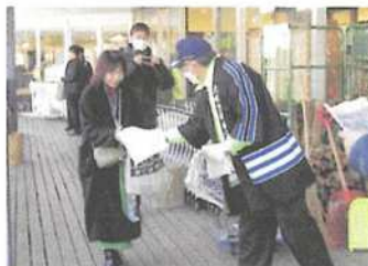
年末の交通事故防止県民運動