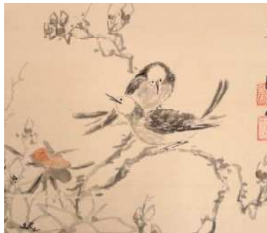
↑奥原晴湖《富貴小禽図》(部分) 当館所蔵

政争の続く明代末期に成立した『菜根譚』という書に鳩毒の記述があります。鳩毒とは鳩という鳥の羽を酒に浸して作った毒薬で、この毒をつかって人を殺すことを鳩殺というそうです。科学的には毒鳥の発見（というか鳥の毒の発見）は意外なこと（？）近代になってからで、1990年代のズグロモリモズが世界初とされています。件の鳩という鳥は現代では特定されていません。もともと空想上の存在なのか、人知れず絶滅してしまったのか、現代では違う鳥として認識されているのか色々な可能性を想像しては楽しくなっています。日本美術に見ることが出来る鳥の絵は単に「花鳥図」や「小禽図」と呼ばれることも多く、その鳥を特定し