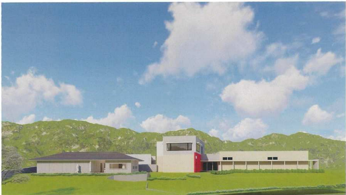
外觀 - 2