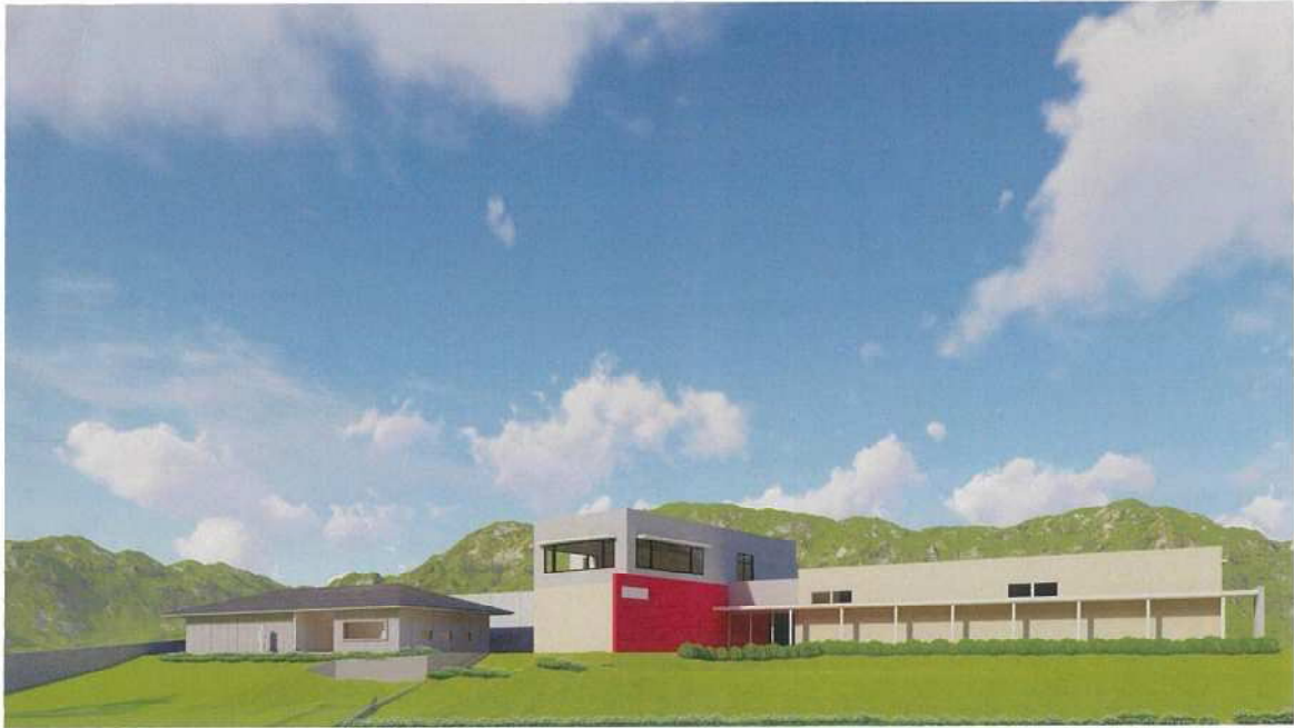
外觀 - 1