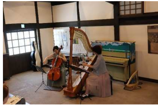
↑ミュージアムコンサート：チェロとハープの調べ