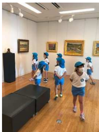
モチーフ探しゲーム