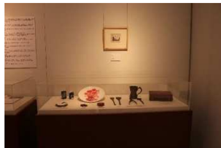
↑ 森田元子展 会場風景