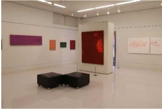
「尾形純絵画展」会場風景