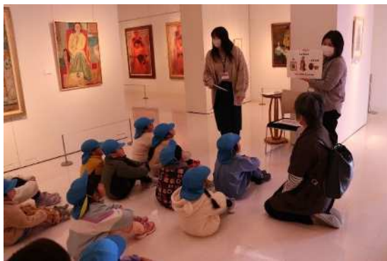
「鑑賞マナー」・「美術館について」を紙芝居にして説明