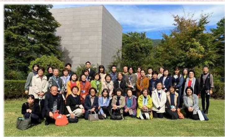
R5.9/16~12/18 まで開催された「荏苒大村美術館収蔵品展」。見慣れた作品も、いつもと違う空間で鑑賞すると、印象が変わります。