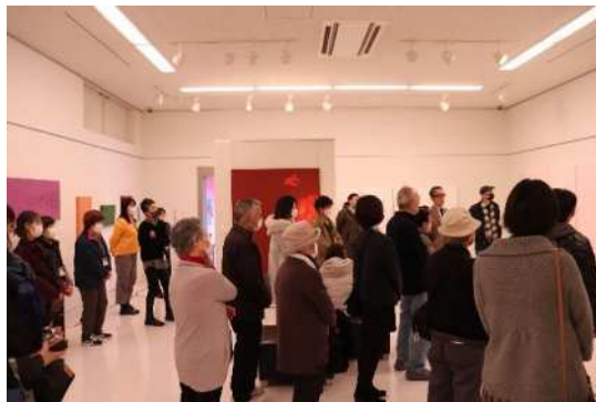
↑「尾形純氏による作品紹介」会場風景