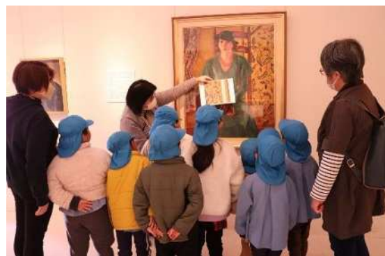
展示室での対話型鑑賞