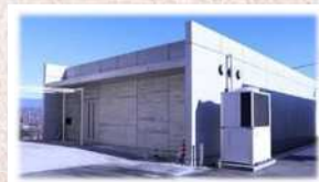
美術館の南側にある大きな建物が収蔵庫