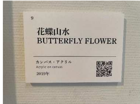
【参考】作品のキャプション