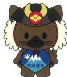
山梨県 キャラクター 武田義丸(ひしまる)

多くの県民の皆様にも本事業に積極的に参加していただき、地球温暖化防止、災害対策に資する太陽光発電設備、蓄電池等の設置を進めて参りましょう。