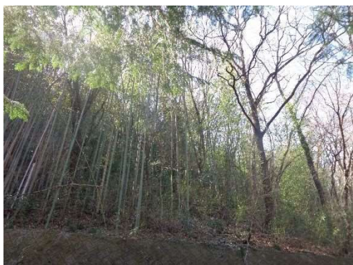
(甘利小通学路伐採前)

また、R4年度より農地と山林を野生動物から守るため、電柵沿いの伐採(緩衝地帯の整備)や管理道の設置を行っております。集落が一体となり、今後の農地の在り方を考える(地域計画)を策定した地域においては、10割補助で事業を行うなど、市民と共同で課題解決に取り組んでおります。