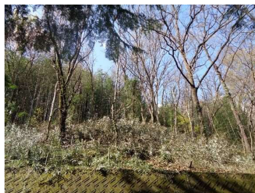
(甘利小通学路伐採後)