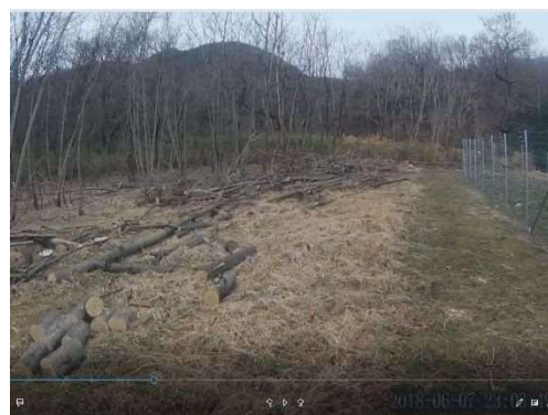
(入戸野地区緩衝帯整備後)