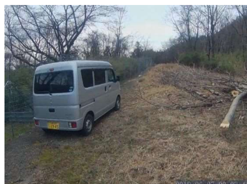
(入戸野地区緩衝帯整備後)