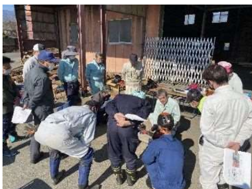
(メンテナンス方法実践)