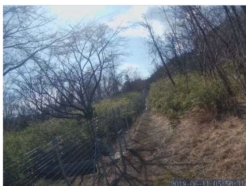
(入戸野地区緩衝帯整備前)