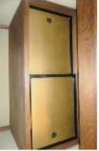
F10A襖引違 ※COW吹き出し口対応の建具2本新規製作