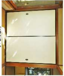
F1襖引違*2 ※COW吹き出し口仕様 の建具2本新規製作