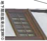
地下階段扉増し窓W10*1