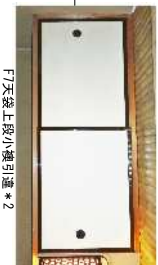
F7天袋上段小襖引違*2