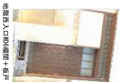
地階西入口WD6幅間+板戸*1