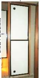
F8天袋下段小襖引違*2