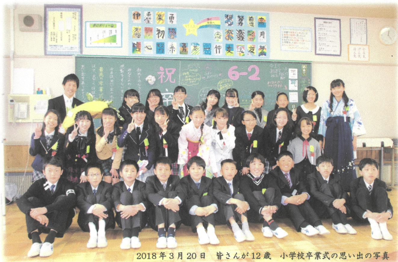
2018年3月20日 皆さんが12歳 小学校卒業式の思い出の写真

二十歳という人生の大きな節目を迎えられたことを 心からお祝いします 今後の活躍を応援しています