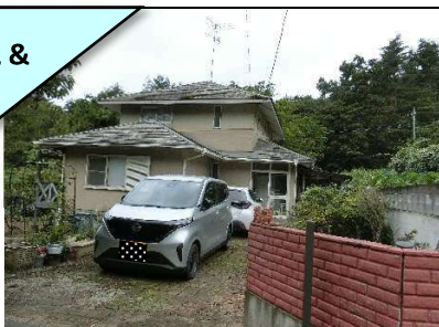
外観 & 1F