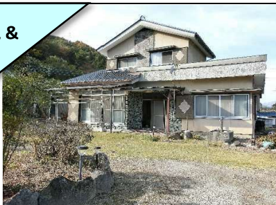
外観 & 1F