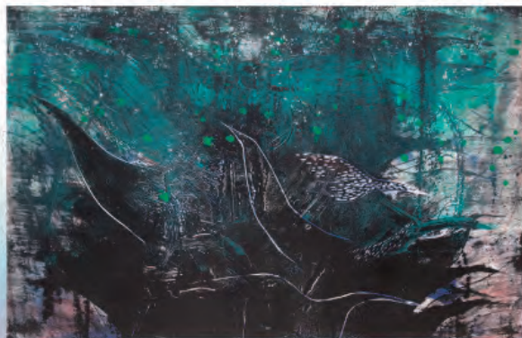
《過去への存在の確証》