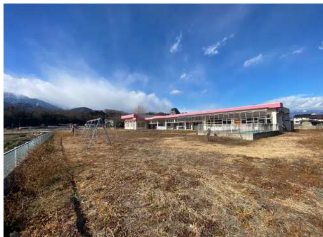
敷地南東側の角から北西側へ