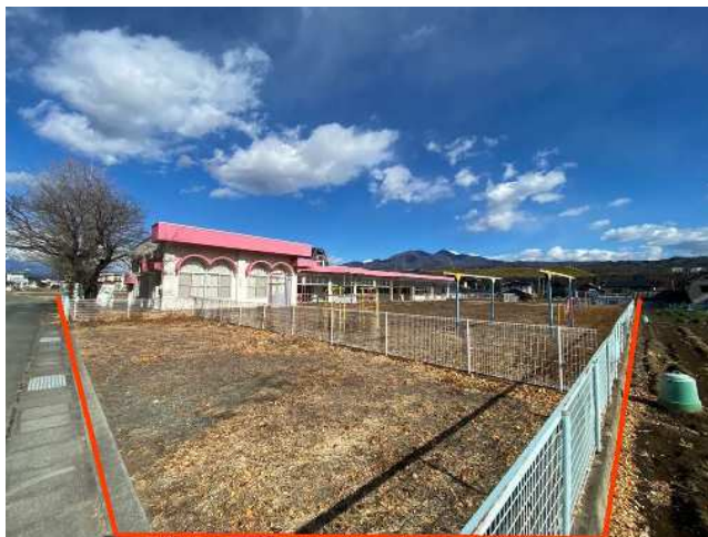
敷地南西側の角から北東側へ