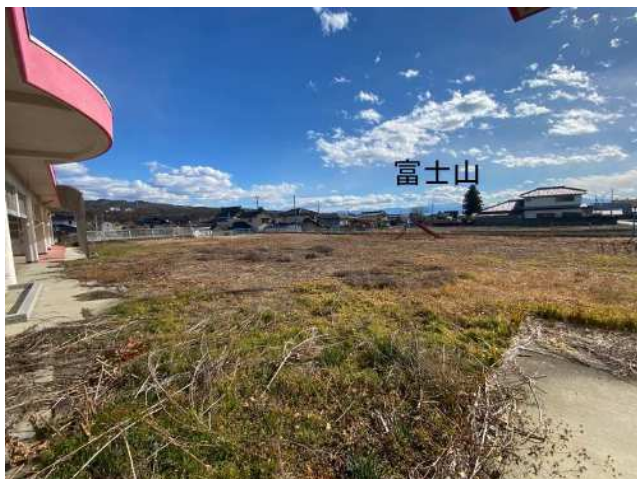
建物前から南側へ