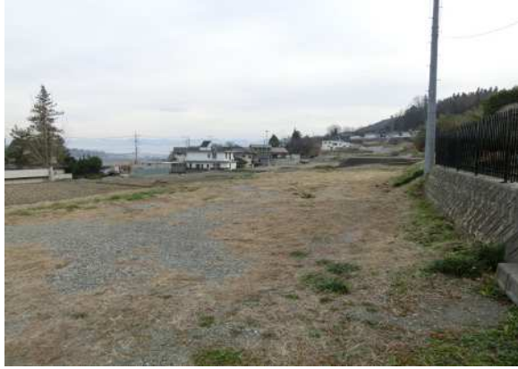
北西側の角から南側へ