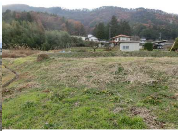
南東側の角から西側へ（高低差有り）