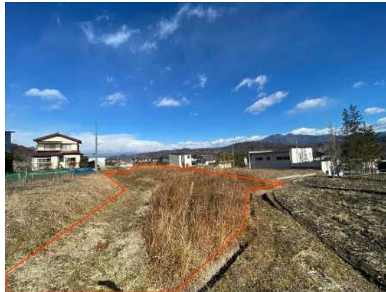
南側の角から北側へ