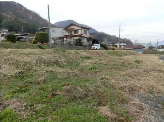
南東側の角から北西側へ（高低差有り）