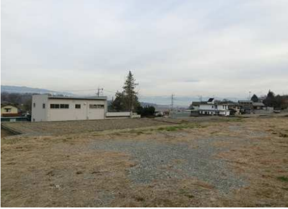
北西側の角から南東側へ