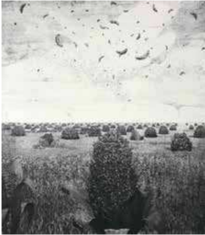
《ある平原》1973-74年 個人蔵