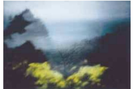
《Twilight Field -Nebukawa VII》2021年 個人蔵