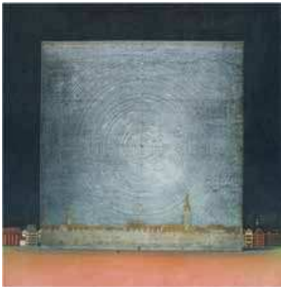
《Planetarium I》1983年 町田市立国際版画美術館蔵 ※7月18日まで展示