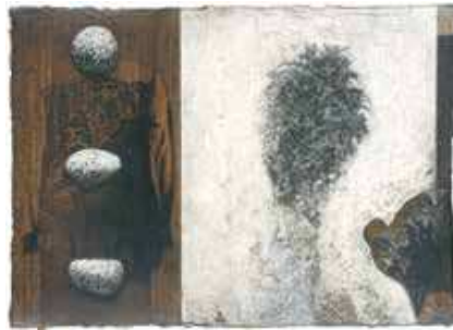
《A corner of the garden XXX》1999年 個人蔵