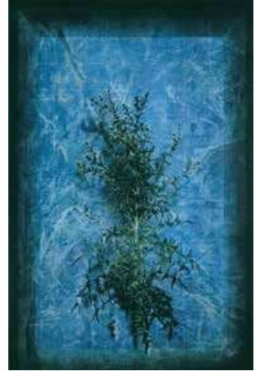
《AZAMI Blue XXIV》2014年 葦崎大村美術館蔵

本展では初期作品から近作までを通して、その変遷を辿ると共に、「プラス」することで生まれる多様な表現に触れて頂き、新たな視点を発見する機会となりましたら幸いです。