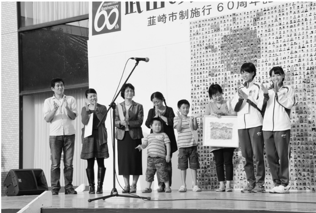
武田の里にらさき・ふるさとまつりで、実際にかなえる5つの「夢や願い」を発表。 (10月12日 星のエリア (中央ステージ) にて)