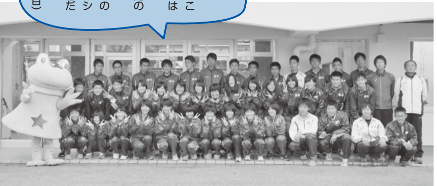
高橋尚子さんの1日臨時コーチの夢がかなった、笑顔の葦崎高校陸上部の皆さん。10月22日葦崎中央公園陸上競技場にて