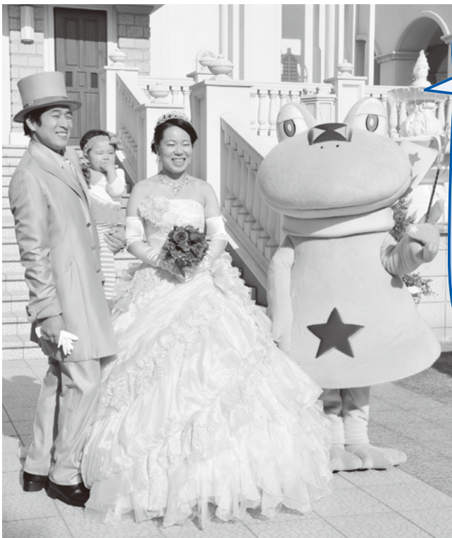
チャペルの前(中世ヨーロッパ風?)で記念撮影!