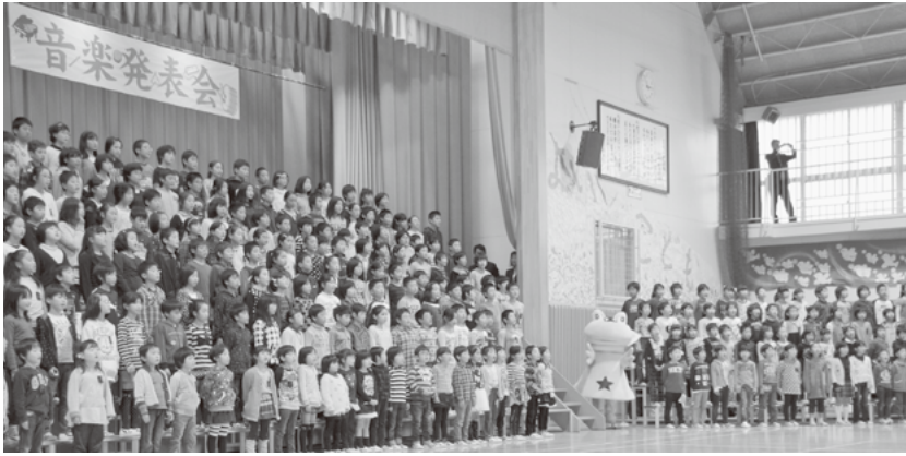
11月1日、葦崎小学校で行われた音楽発表会での全校合唱。