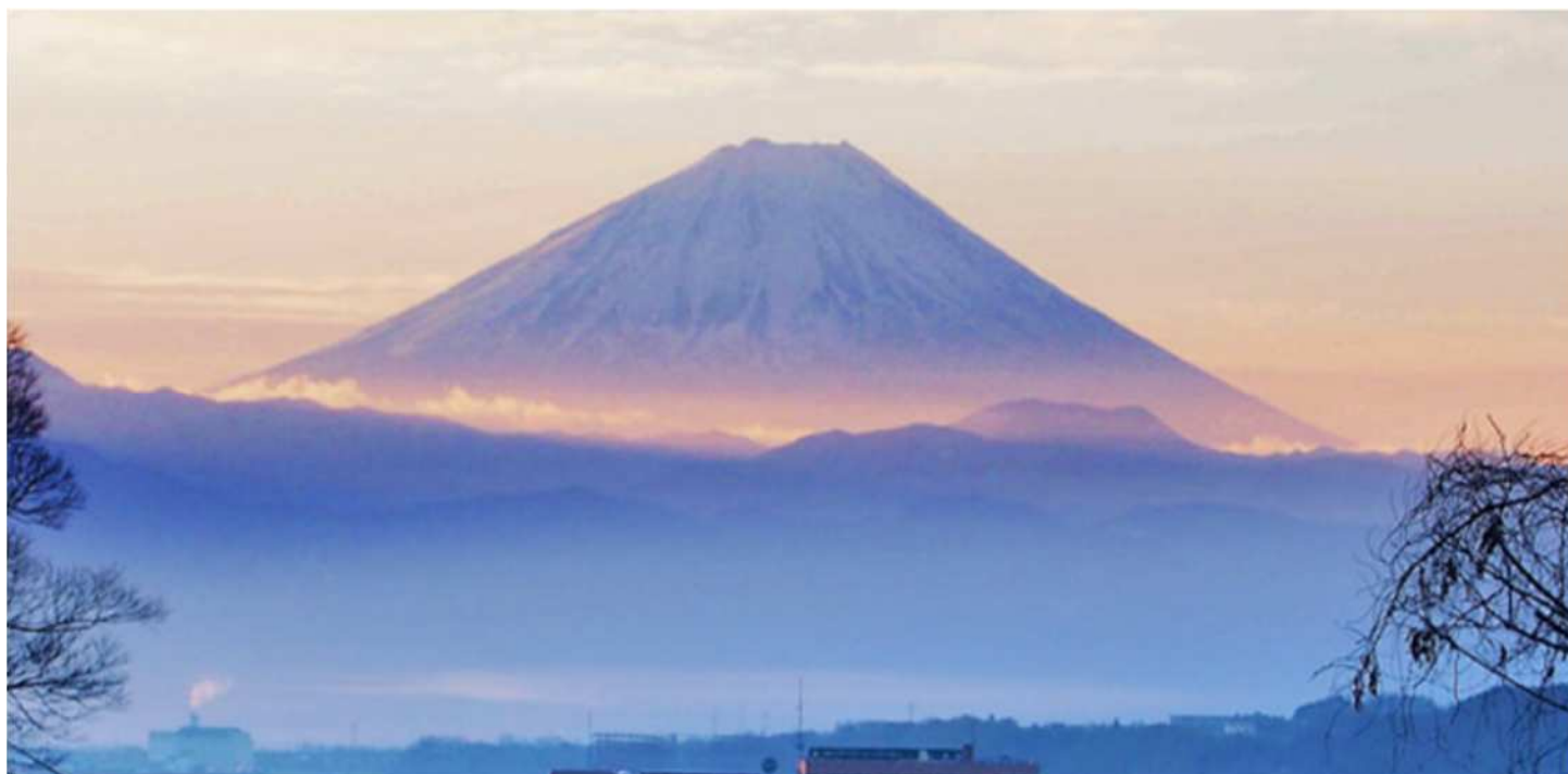
七里岩トンネル上から眺める富士山