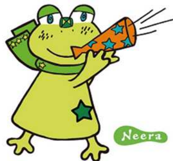
韮崎市イメージキャラクター ニーラ