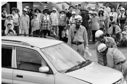
峡北消防本部の隊員による救出訓練 (旭町山口地区)