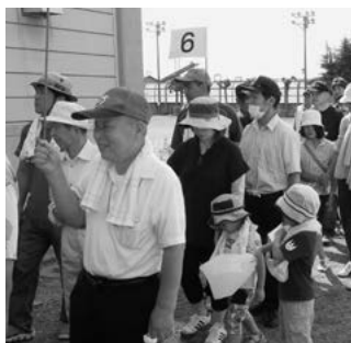
班編成による避難の様子 (韮崎北西小学校)