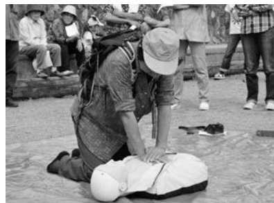
AEDによる救命救急訓練の様子 (旭町山口地区)