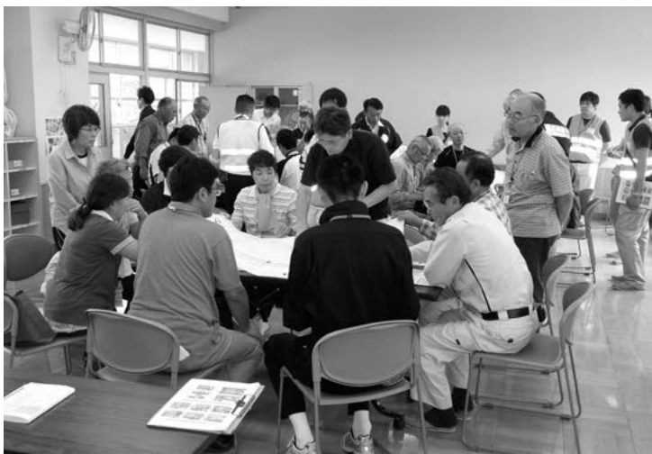
地域住民による小学校での施設利用合意書の作成訓練の様子 (韮崎北西小学校)

災害発生時には、自分の身は自分で守るという「自助」と自分たちの地域は自分たちで守るという「共助」が大変重要になりますので、東日本大震災や、広島で発生した大規模土砂災害等を教訓に、日ごろから災害に備えましょう。