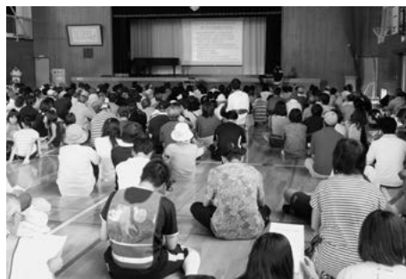
NPO 減災ネットやまなしによる、減災講習 (韮崎北西小学校)