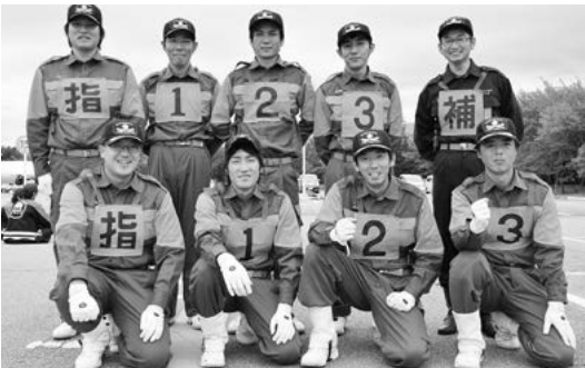
大会に出場した旭分団の選手の皆さん