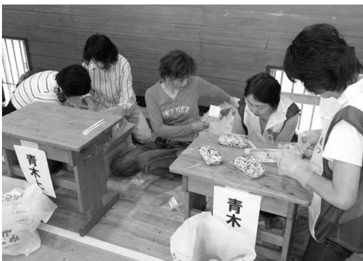
非常食(アルファ米)炊き出し訓練の様子(韮崎北西小学校)