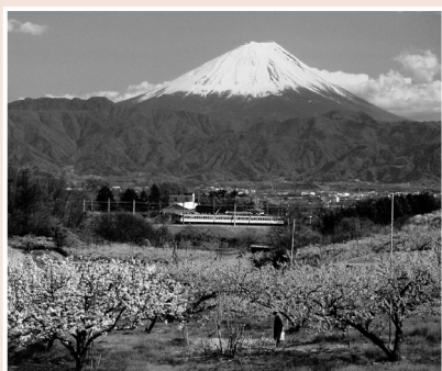
過去入選作品『春の丘』

■応募期限 平成30年2月15日(木) ■応募先 韮崎市観光協会 ☎22-1991