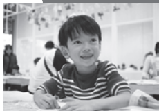
小学生のみんなあつまれ~!

「夏休みの友」の工作(材料各自持参)や オリジナル トートバッグ(材料費 500円)を お兄さん・お姉さんと一緒につくろう。