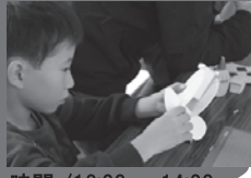
時間 / 12:00 ~ 14:30 場所 / 地下1階「ミアキス」

子育てを応援する団体や個人の方々と韮崎市が一緒 になって、子育て中のみなさまを応援し、楽しんでい ただくためのイベントです。