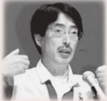
みなみ らんぼう氏 (シンガーソングライター)