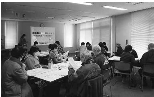
高血圧予防教室の様子

※1 健康診査結果用紙等 ※2 各種がん検診結果用紙等 ※3 実践記録票(ピンク色) ※4 出席簿(青色)等 注) Bのがん検診については何種類受けても30ポイントまでとします。