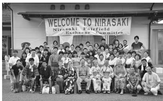
▲今年度も姉妹都市交流事業へ参加協力

山梨県女性のつばさ蕪崎会は、昭和60年から、県の海外派遣事業の「山梨県婦人のつばさ」「山梨県女性のつばさ」「やまなし女性海外セミナー」に参加した女性の皆さんで構成され、そのうちの蕪崎市に在任する会員の方々が、平成8年に蕪崎会を発足させ現在に至っています。