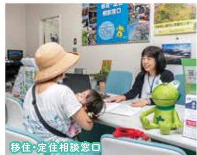
移住・定住相談窓口