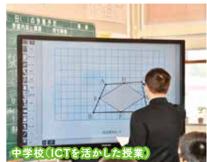
中学校（ICTを活かした授業）