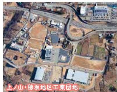
上ノ山・穂坂地区工業団地