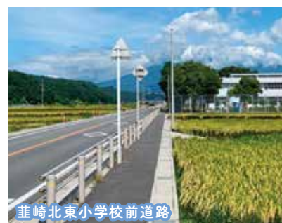
斐崎北東小学校前道路