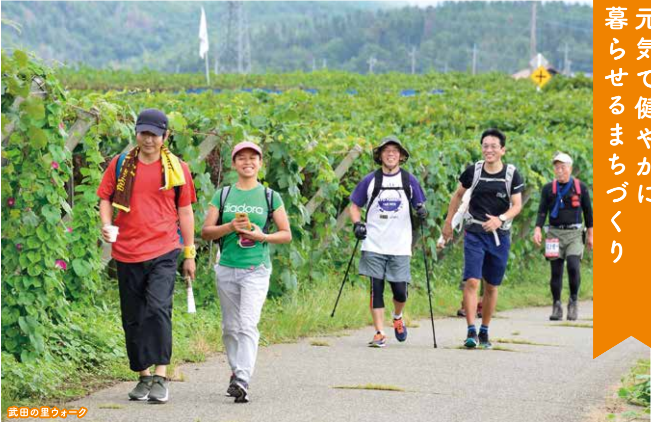
武田の里ウォーク