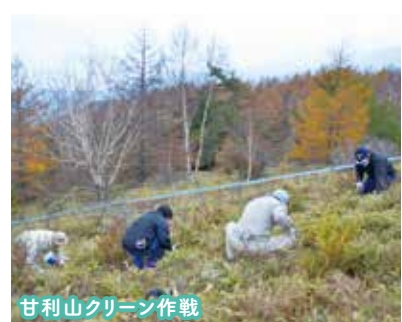
甘利山クリーン作戦