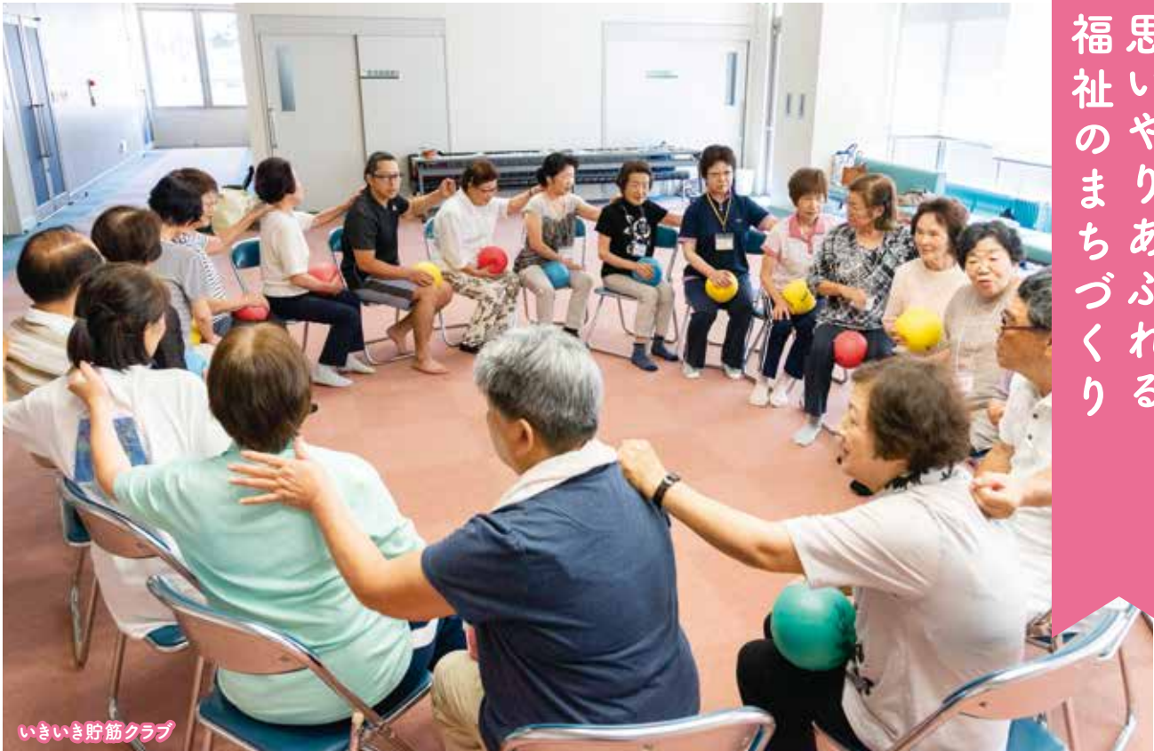
いきいき貯筋クラブ