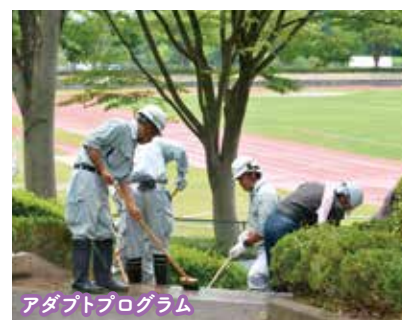
アダプトプログラム