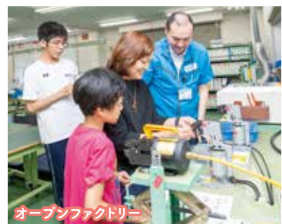
オープンファクトリー