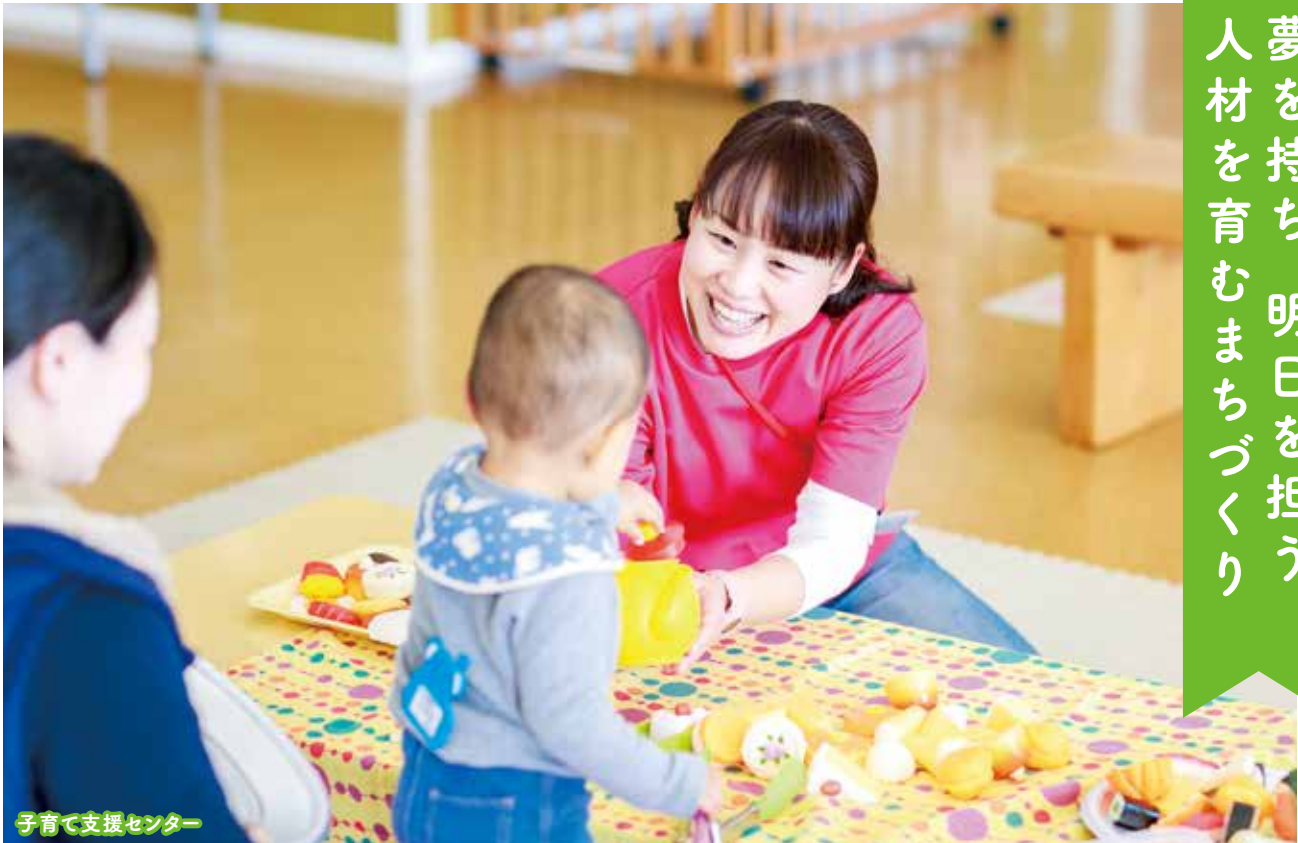
子育て支援センター