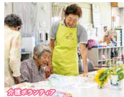
介護ボランティア