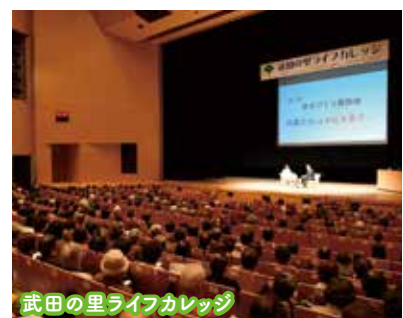
武田の里ライフカレッジ