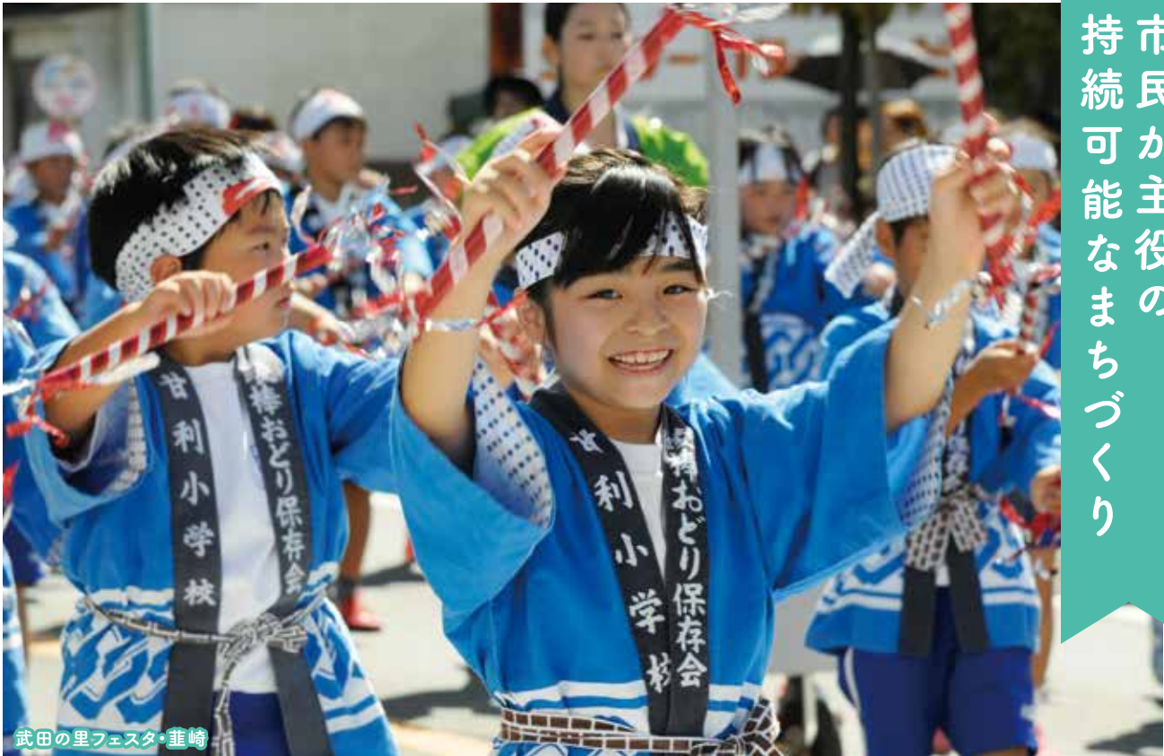
武田の里フェスタ・葦崎