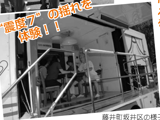
藤井町坂井区の様子