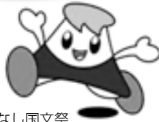
富士の国やまなし国文祭 マスコットキャラクター「カルチャくん」