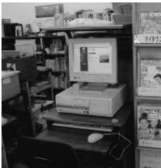
市立図書館に設置されたパソコン

萑崎市では、地域インターネット事業により萑崎市役所と光ケーブルで結んだパソコンを市立図書館・ゆーぶる萑崎・道の駅に1台ずつ設置し、インターネット閲覧用として一般の方に開放しますのでインターネットに興味のある方は自由にご利用ください。