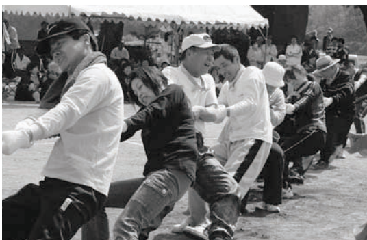
中田町体育祭より地区対抗の綱引き

☆空き店舗を利用した出店者に対する 補助制度について、詳しくは市HP (産業・まちづくり)をご覧ください。