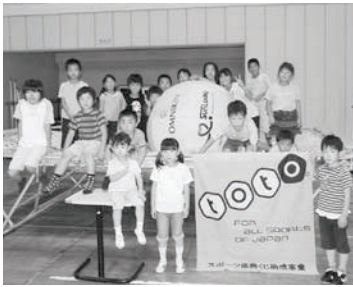
子どもスポーツ体験の様子