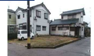
新潟県燕市(土地) 譲渡額約350万円