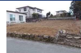
三重県津市(土地) 譲渡額約270万円