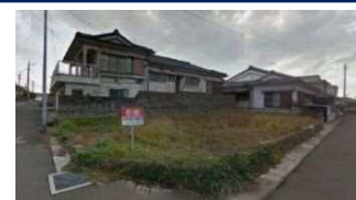
鹿児島県いちき串木野市(土地) 譲渡額約350万円