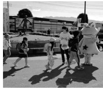
5月30日は「ごみゼロ」の日!