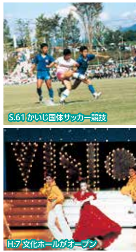
S.61 かいじ国体サッカー競技