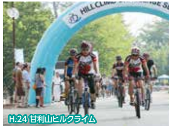
H.24 甘利山ヒルクライム