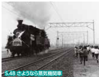
S.48 さよなら蒸気機関車