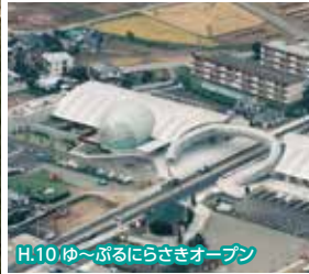
H.10 ゆ〜ぶるにらさきオープン