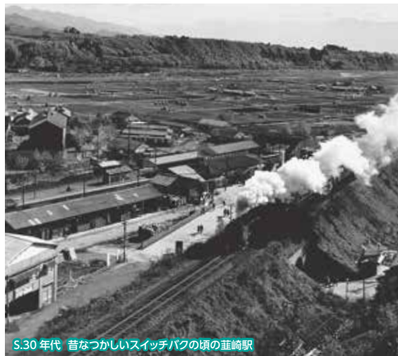
S.30 年代 昔なつかしいスイッチバックの頃の葦崎駅