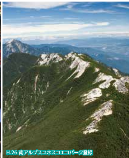
H.26 南アルプスユネスコエコパーク登録