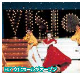
H.7 文化ホールがオープン