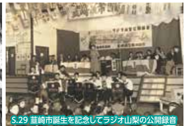
S.29 葦崎市誕生を記念してラジオ山梨の公開録音