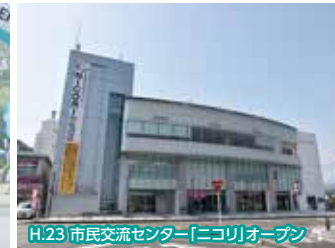
H.23 市民交流センター「ニコリ」オープン