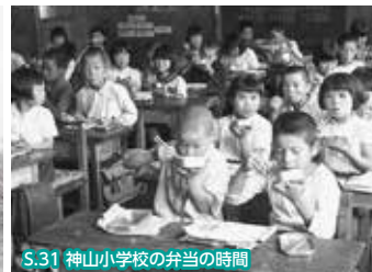
S.31 神山小学校の弁当の時間