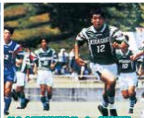
H.8 全国高校総体サッカー競技開催

フェアフィールド市の高校生交換留学が始まる。第1回全国スポーツレクリエーション祭の壮年サッカー、武田の史跡ウォーキングが本市で開催。