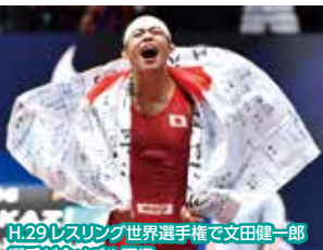
H.29 レスリング世界選手権で文田健一郎選手が金メダル獲得