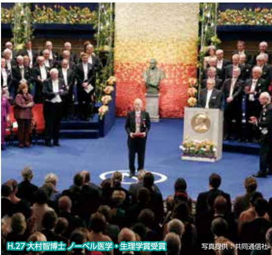
H.27 大村智博士 ノーベル医学・生理学賞受賞