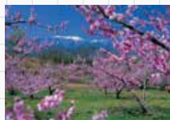
新府の桃と鳳凰三山