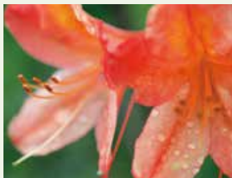
市の花 レンゲツツジ(平成21年10月制定)