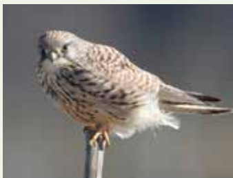
市の鳥 チョウゲンボウ(平成元年4月制定)