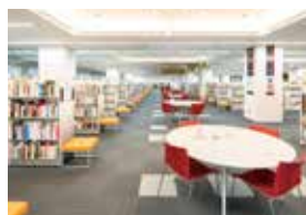
富士市立大村記念図書館