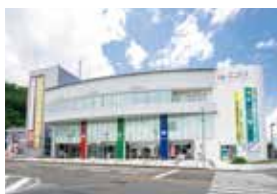
富士市民交流センター「ニコリ」