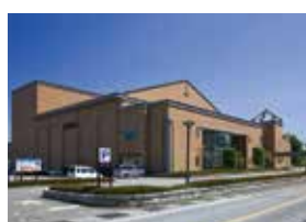
東京エレクトロン蕪崎文化ホール