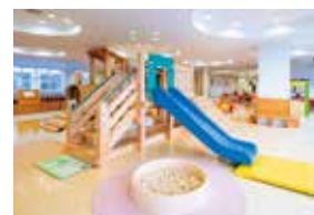
富士市子育て支援センター