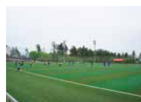
グリーンフィールド穂坂