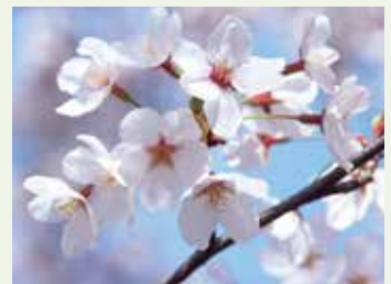
市の木 さくら(平成21年10月制定)