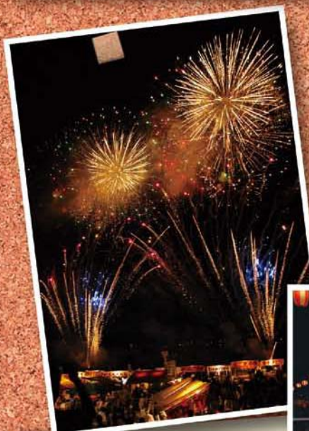
夏の武田の里まつり (8月16日)