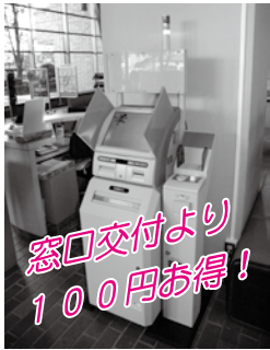
市役所1階の自動交付機