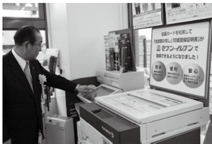
セブンイレブンの多機能端末で住民票の写しを取得する横内市長