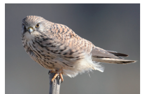
市の鳥 チョウゲンボウ (平成元年4月制定)