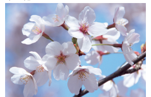
市の木 さくら (平成21年10月制定)