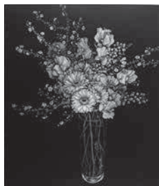
丹阿弥 丹波子《花・雨》2008年 銅版画 メゾチント 42.0×36.5cm

20点を紹介します。漆黒の闇に浮かび上がる、花や野菜などの美しい姿をご覧ください。