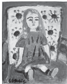
鈴木 信太郎《青い人形》 油彩 40.0×31.0cm

1階企画展示室において、明治から昭和にかけて活躍し、色鮮やかな色彩と、親しみやすく愛らしい画風で知られる鈴木信太郎の作品を紹介します。各地の風景をはじめ、人形や桃やバラなど、色彩豊かで、独特の世界観の漂う観る人の心が温まるような作品を紹介します。油彩画、水彩画、挿絵の原画など約40点を紹介します。