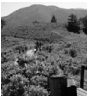
甘利山山頂までの遊歩道