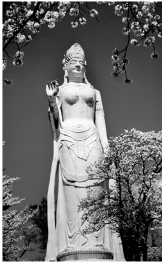
韮崎平和観音 市民の平和と安全無事を祈願し、3年の歳月を要して、昭和36年に建立された。 建設途中には、伊勢湾台風により釜無川が氾濫、本市は大きな災害を被り、2度と災害を受けないようにとの願いも込められた。