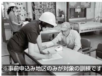
※事前申込み地区のみが対象の訓練です

1回目には、午前7時。台風や大雨等を想定した場合の 要配慮者（発災時に介助を必要とする方）の優先避難訓練 のため、防災行政無線で市内全域に「避難準備情報（訓練情報）」を放送します。 この訓練に参加される方は、福祉避難所に避難を開始してください。