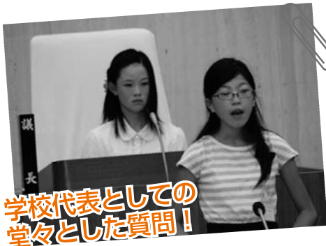
学校代表としての堂々とした質問！