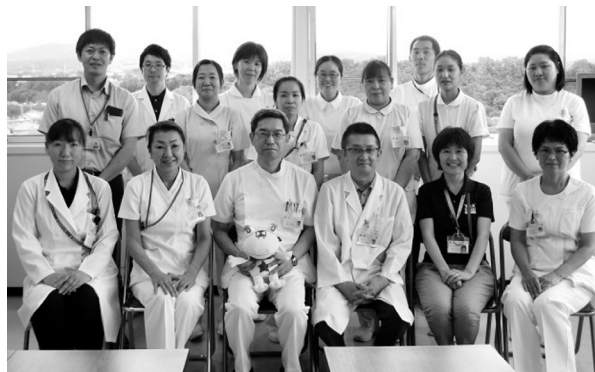
「私たちが支援します!!」

食事負担額、手術費用、保険外費用は別途ご請求します。後期高齢者(75歳以上)及び高額療養費限度額認定証を持参した方については、医療費の上限が定められていますので、一般病床の場合と負担上限に変わりはありません。(一部、出来高算定となる場合があります。)