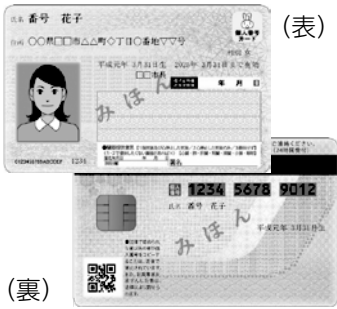
▲図3 マイナンバーカード

平成27年10月以降に簡易書留にて各世帯に送付させていただいた通知カード(図2)について、紛失等され、お手元がない場合は再発行することができます。なお、再発行する場合はお手元に届くまでに約1ヶ月程度かかりますので、必要な方は早めに手続きをお願いいたします。すぐにマイナンバーが必要になる場合は「マイナンバー(個人番号)入り住民票の写しの交付請求について」をご参照ください。平