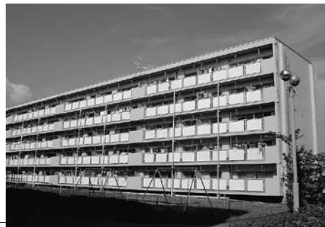
写真：サンコーポラス龍岡住宅

市では、市内にある雇用促進住宅を全戸購入し、平成23年4月より市営定住促進住宅として管理・運営を開始します。