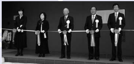
企画展オープニングセレモニー(10月17日)