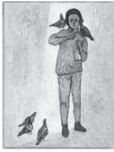
荻太郎《ハトと少女》

私たちの身近に暮らすいきものや、目には見えない小さないきもの。描かれたいきものたちの作品を紹介しています。ぜひご家族でご来館ください。