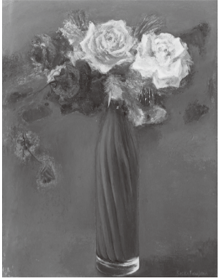
金山桂子《赤いガラス花瓶とバラ》

花の女王といわれるバラは、贈り物や園芸・鑑賞用植物として好まれ、日本では万葉の時代より和歌に詠まれるなど、人々の心をとらえてきました。美術の世界を見ても多くの作家がバラに魅了され、またインスピレーションを受け、作品として形に残っています。当館のコレクションにおいても、バラをモチーフとした作品が数多くあります。 本展では、そのコレクションの中から選りすぐった33点を紹介