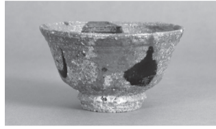
河井寛次郎《色繪茶盃》