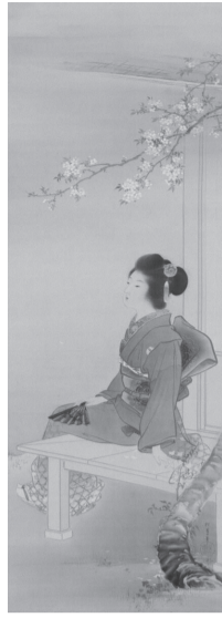
上村松園《櫻下處女圖》