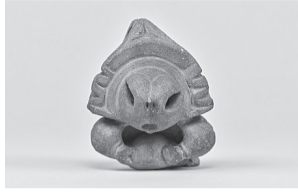
★期間限定！里帰りします★ 「顔(把手)」(葦崎市出土、東京国立博物館蔵)

■問い合わせ(休館日除く、10時～18時) 葦崎大村美術館 ☎・📠23-7775